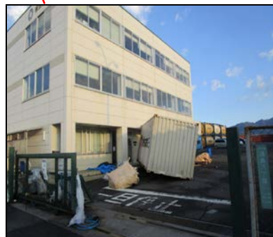
コンテナの倒壊、ゴミの散乱