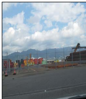
浸水の影響はあまり見られず