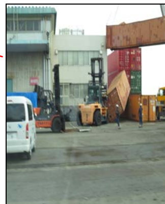
コンテナが横転、復旧作業中