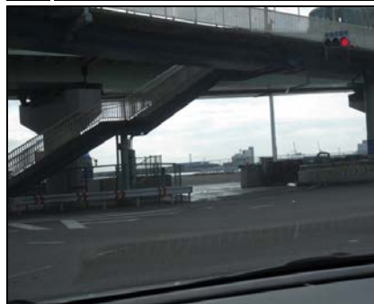
浸水の痕跡は見られなかったが ヤードにはゴミの散乱が見られた