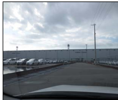
浸水の痕跡が見られた