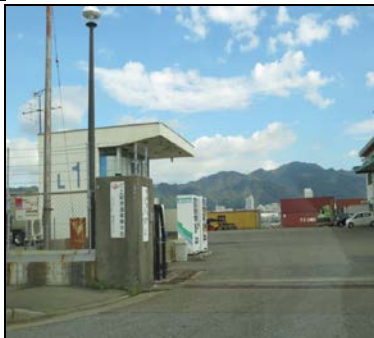
浸水の痕跡はあまり見られず